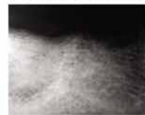
3. Radiografia a 5 mesi