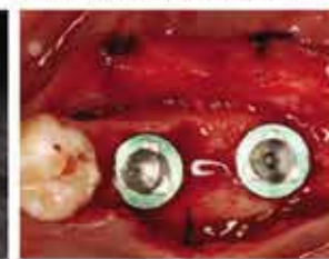
4. Sito rigenerato con impianti inseriti