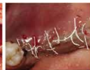
2. Sutura senza uso di membrane